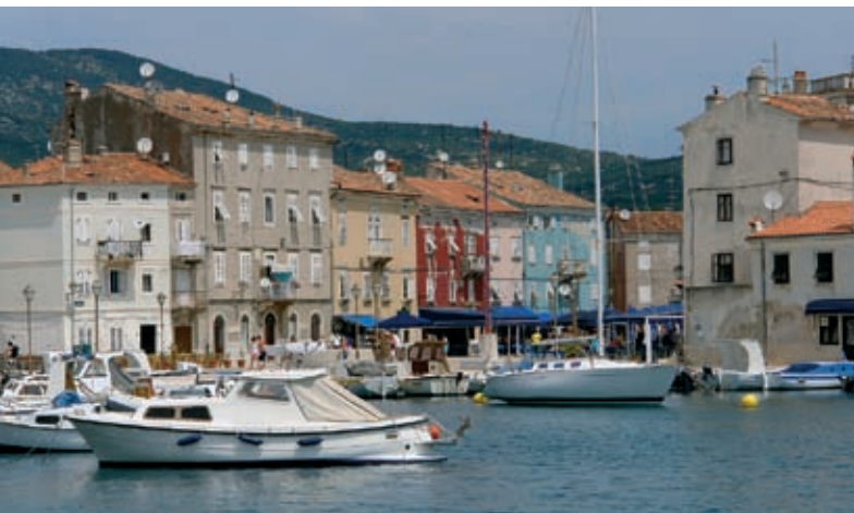
for. © Stockphoto | matelijn

„Stolica” wyspy (ponad 2000 mieszkańców) jest położona w jej środkowej części, na zachodnim wybrzeżu (odnoga Creskiego zaljevu), u podnóża wzniesienia Gerbujev (353 m n.p.m.). Miasto, oddalone o 26 km od przystani promowej, leży nad zachodnią zatoką, otoczoną wzgórzami, których stoki, pokryte winnicami, łagodnie schodzą w kierunku morza. Nie ma tu wyróżniających się zabytków, ale całość sprawia bardzo korzystne wrażenie.