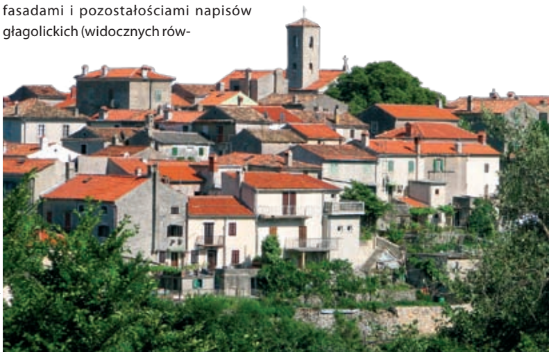
fat. © iStockphoto | simonkr

Miasto-muzeum ma nadal średniowieczny wygląd. Na jednym z okolicznych wzgórz zachował się plac podobny do amfiteatru, stanowiący miejsce spotkań, a na nim cysterma publiczna na wodę, loggia miejska i obiekty sakralne. Najładniejszy jest tu mały romański kościółek św. Marii (sv. Marije) ze zbiorem cennych krzyży procesyjnych z XIII–XIV w., zgromadzonych w zakrystii. Równie interesujące są: romańska katedra z dzwonicą oraz gotycki kościół św. Antoniego (sv. Antuna) z pocz. XV w., stojący na cmentarzu. Będąc w mieście, warto pospacerować uliczkami wśród domów z małymi balkonami, dekoracyjnymi fasadami i pozostałościami napisów gągolicznych (widocznych rów-